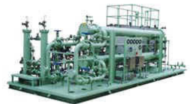
Sistema de Lubrificação Centralizado

O assunto não se esgota na discussão destes pontos, mas estes devem ser levados em consideração na seleção do melhor sistema de lubrificação. A discussão prévia com um especialista poderá tornar este processo indolor.